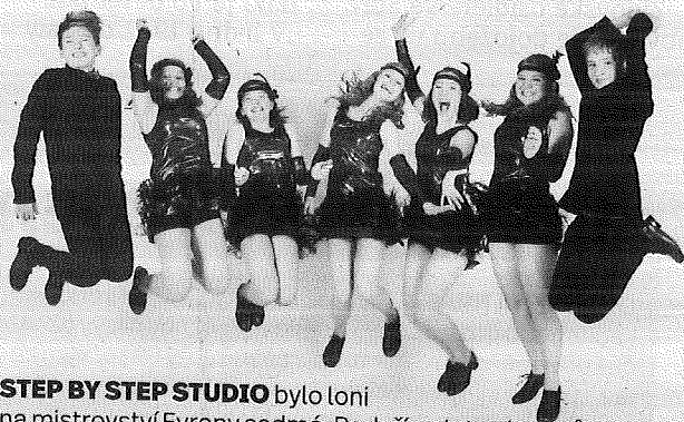
STEP BY STEP STUDIO bylo loni na mistrovství Evropy sedmé. Podaří se letos juniorům se skladbou Charlie výsledek zlepšit?